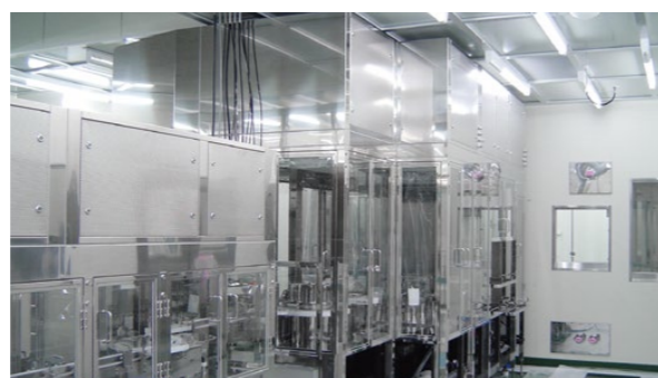
コンベア用ラミナーフローシステム