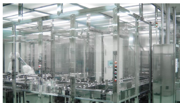
ラミナーフローシステム